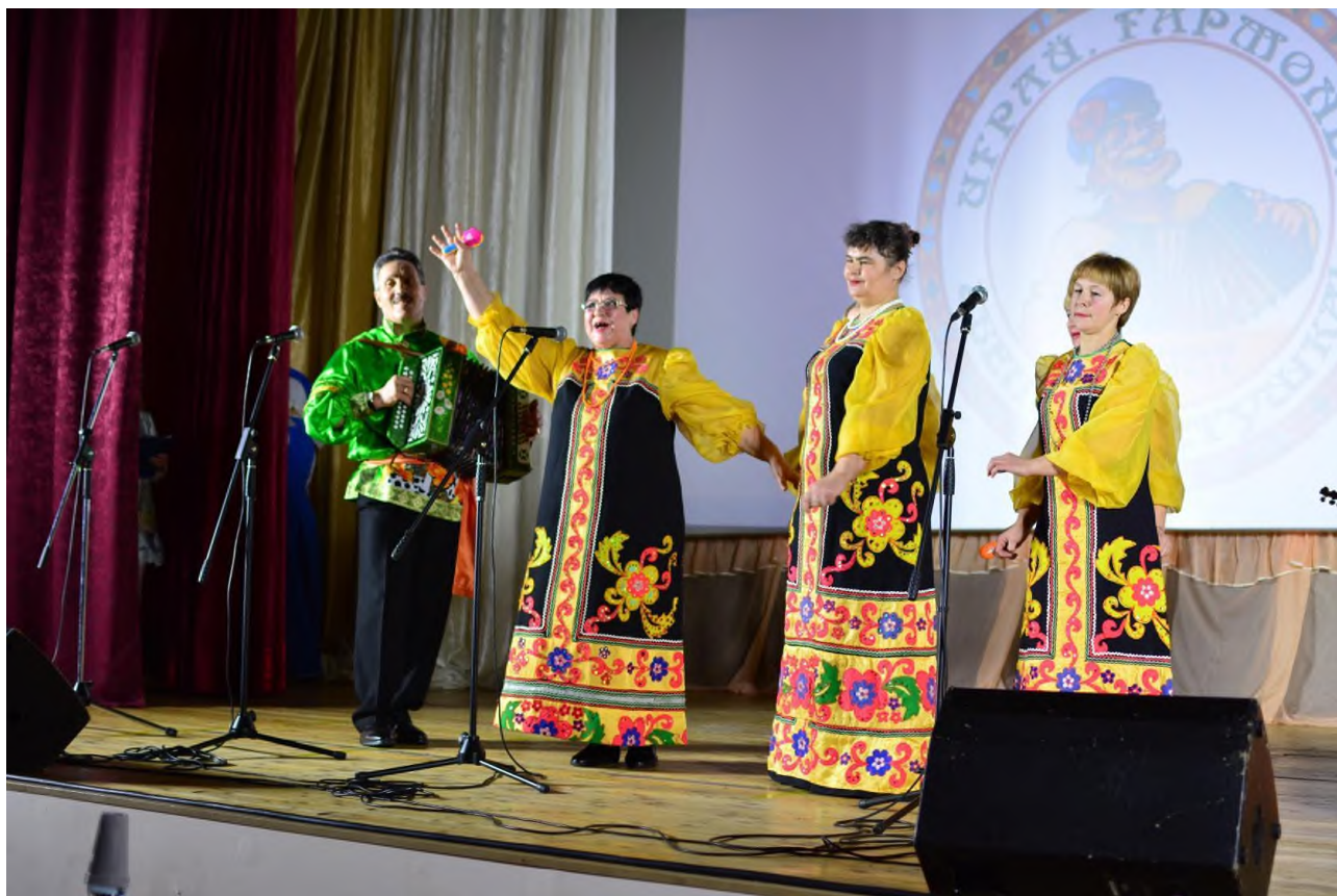
Международный день танца