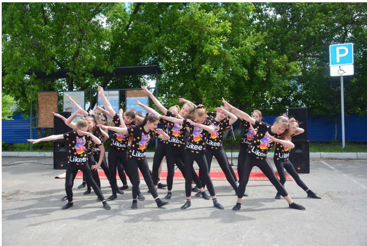
День села «Чернецовка-2022»