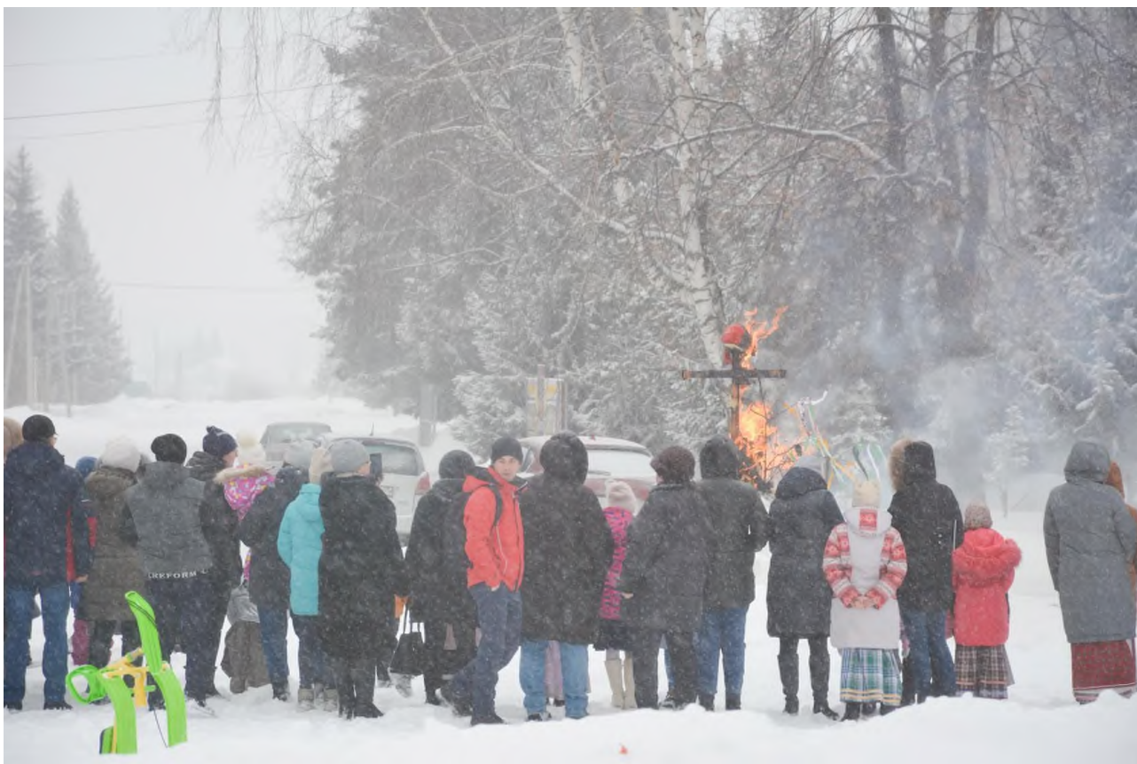
Районный фестиваль «Играй гармонь-2022» проходит ежегодно в декабре