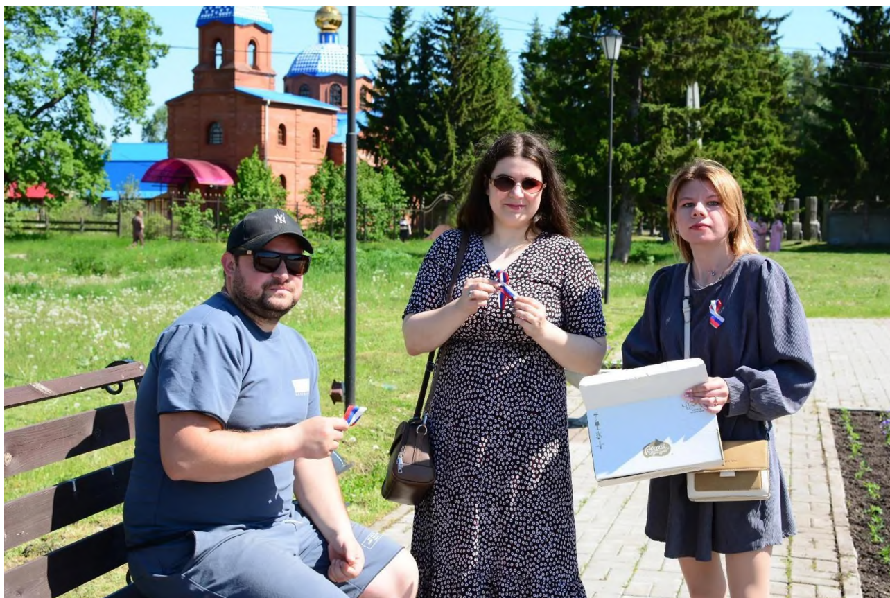
День защиты детей - 2024